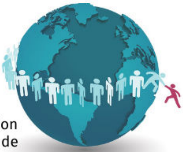
Données démographiques de la CMEZ